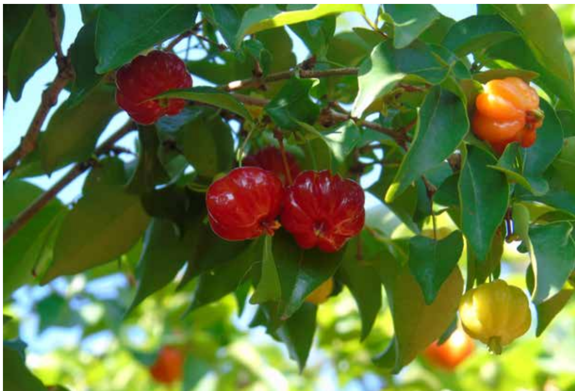
FIGURA 3 - Frutos de Eugenia uniflora .

Uma outra opção, seria utilizar, inicialmente, o espaçamento de 1x1m (10.000 plantas/ha) eliminando-se, alternadamente, uma planta, quando as copas começarem a se tocar, ficando no espaçamento de 2x2m (2.500 plantas/ha). Novamente, quando as copas começarem a se entrelaçar, aumentando a competitividade, pode-se eliminar uma ou outra planta, alternadamente, dando-se assim, o espaçamento definitivo de 4x4m. Adotando-se essa