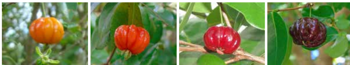
FIGURA 5 - Variabilidade para cor de frutos de diferentes acessos da Coleção de Germoplasma de pitanga do IPA, Itambé, PE.

Nos acessos conservados no Brasil, observa-se a existência de uma ampla diversidade genética manifestada, principalmente, pela cor do fruto maduro, variando do vermelho-claro até o quase negro. Mattos (1993) registrou a existência de uma variedade botânica denominada pitanga-preta ( E. uniflora var. rubra Mattos), cujos frutos são de coloração atropur-