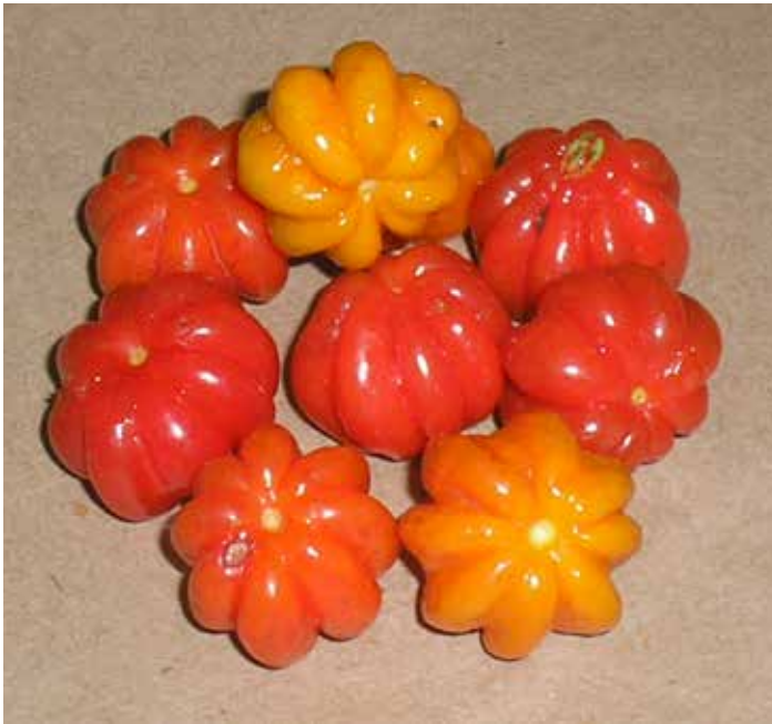
FIGURA 4 - Frutos de pitanga, cultivar Tropicana.

prática, a produtividade inicial e intermediária será bem maior, não havendo nenhum prejuízo na população do pomar a ser formado.