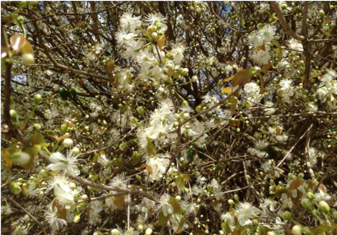
FIGURA 2 - Flores de Eugenia uniflora .

ASPECTOS ECOLÓGICOS, AGRONÔMICOS E SILVICULTURAIS PARA O CULTIVO: A pitangueira vegeta e produz muito bem em climas quentes e úmidos, embora adapte-se bem ao clima temperado e a diferentes altitudes. É resistente à ventos fortes, geadas ou mesmo temperaturas negativas. Apresenta certa tolerância à seca, desenvolvendo-se bem em condições semiáridas, desde que se proporcione uma mínima quantidade de água. Não é tolerante à salinidade. Em relação aos solos, cresce adequadamente em diferentes tipos de solo, tanto nos tipos arenosos (como os de restinga e praia) quanto nos areno-argilosos, argilo-arenosos, argilosos e até mesmo em solos pedregosos (Sanchoatene, 1985; Villachica et al., 1996; Demattê, 1997).