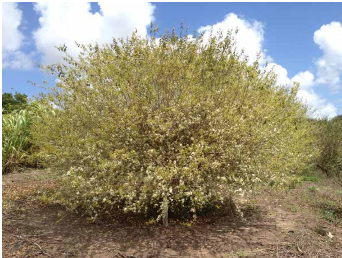
FIGURA 1 - Planta adulta de Eugenia uniflora em plena floração.

As folhas da pitangueira possuem propriedades medicinais e são empregadas na medicina popular no tratamento de febre, doenças do estômago, hipertensão, obesidade, reumatismo e bronquite. Também tem ação calmante, anti-inflamatória e diurética. A indústria cosmética utiliza a polpa dos frutos e os óleos essenciais na fabricação de xampus, sabonetes e perfumes. Devido ao seu porte arbustivo, resistência à podas sucessivas, crescimento lento, copa densa e compacta, a planta é recomendada para uso como cerca viva e na arborização urbana (Correa, 1978; Villachica et al., 1996).